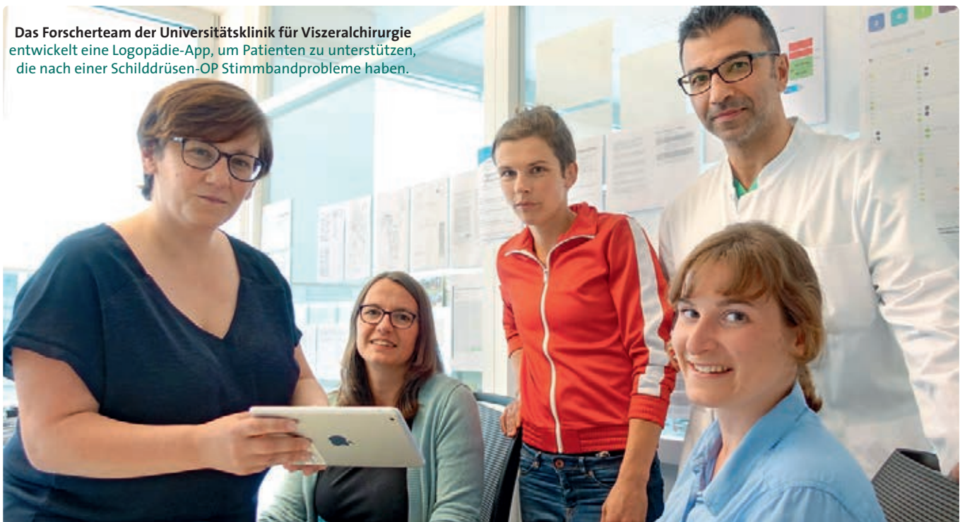
Das Forscherteam der Universitätsklinik für Viszeralchirurgie entwickelt eine Logopädie-App, um Patienten zu unterstützen, die nach einer Schilddrüsen-OP Stimmbandprobleme haben.

Eine Stimmbandlähmung mit heiserer, verhauchter und leiser Stimme, eine eingeschränkte Atmung, die die Kommunikationsfähigkeit mindert, sowie Schluckstörungen können neben weiteren Symptomen zu den unerwünschten Begleiterscheinungen einer Schilddrüsenoperation gehören. Aber auch bei einem Teil der Patienten, deren Stimmbänder nach einer Operation intakt sind, kann es zu einer Veränderung der Stimme kommen. Für beide Gruppen untersucht die Universitätsklinik für Viszeralchirurgie im Pius-Hospital nun, inwiefern eine Logopädie-App helfen kann, Beschwerden und Stimmqualität zu verbessern.