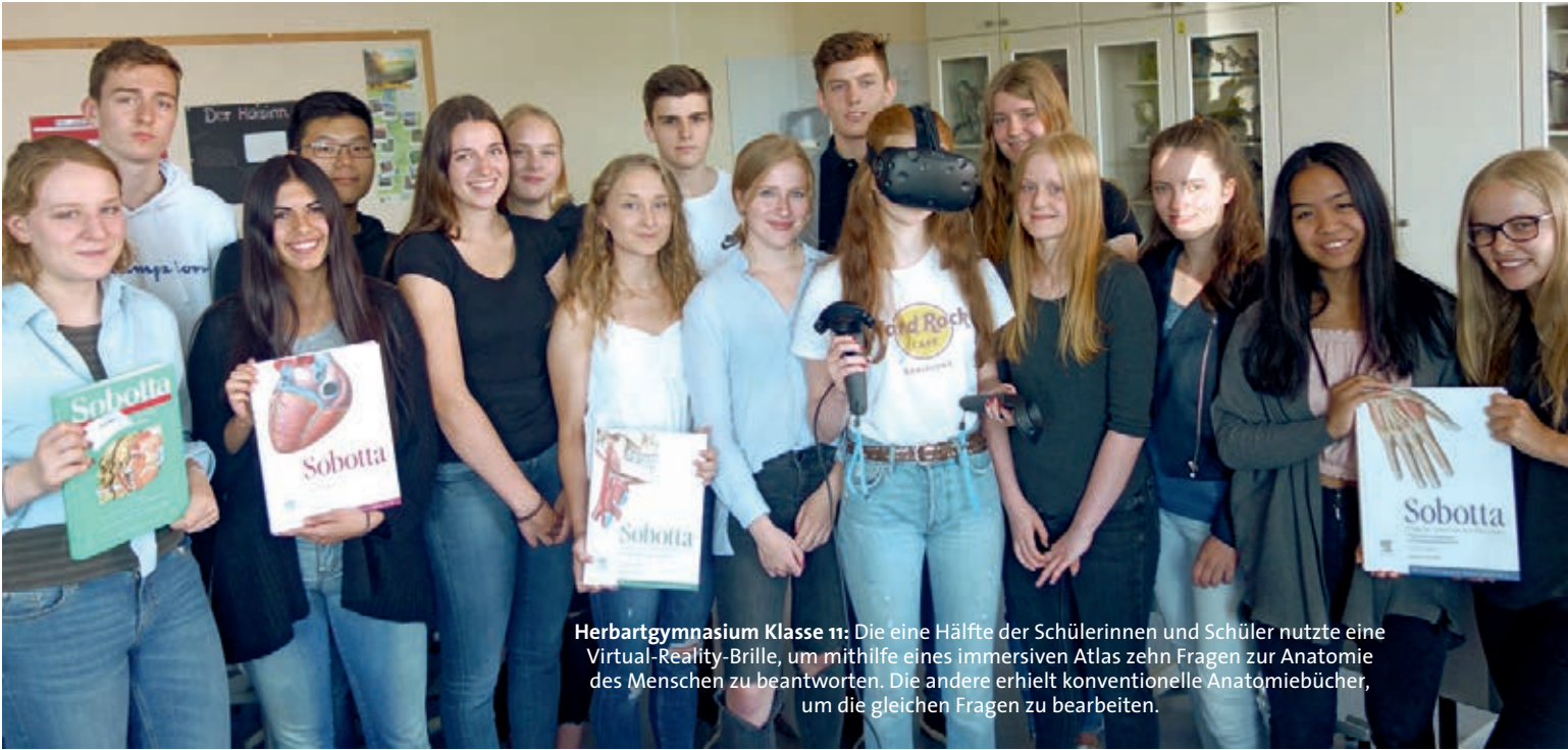
Herbartgymnasium Klasse 11: Die eine Hälfte der Schülerinnen und Schüler nutzte eine Virtual-Reality-Brille, um mithilfe eines immersiven Atlas zehn Fragen zur Anatomie des Menschen zu beantworten. Die andere erhielt konventionelle Anatomiebücher, um die gleichen Fragen zu bearbeiten.