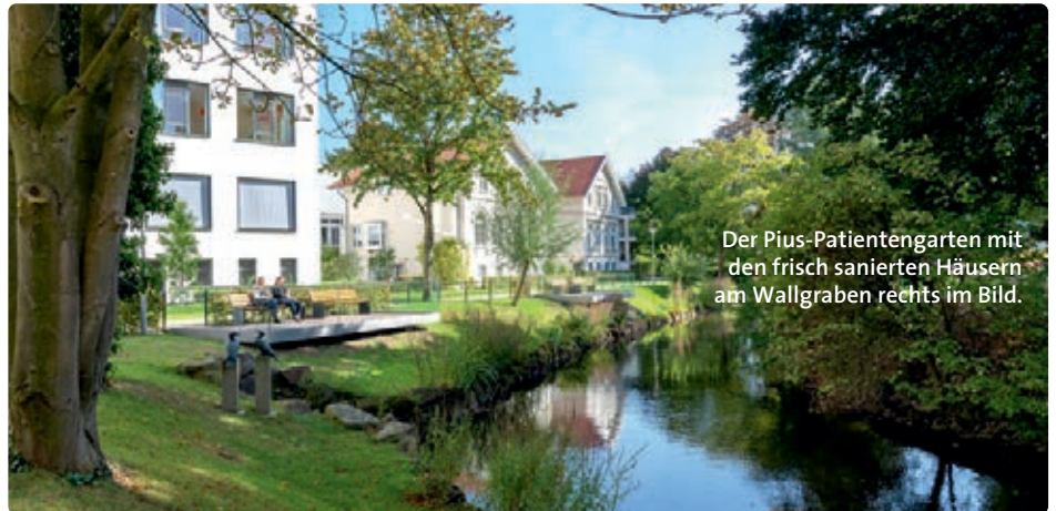
Der Pius-Patientengarten mit den frisch sanierten Häusern am Wallgraben rechts im Bild.